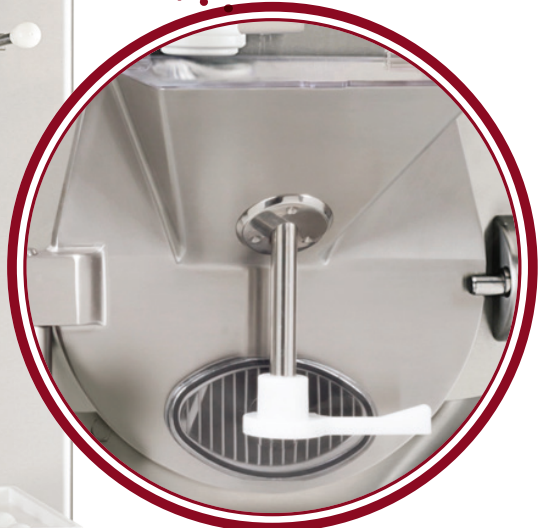
portello Silver Silver door