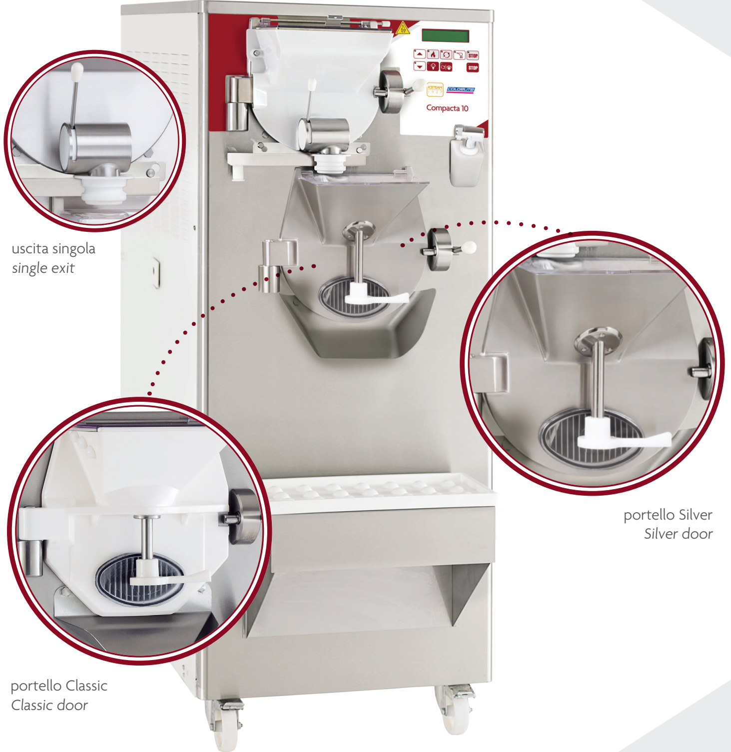
uscita singola single exit