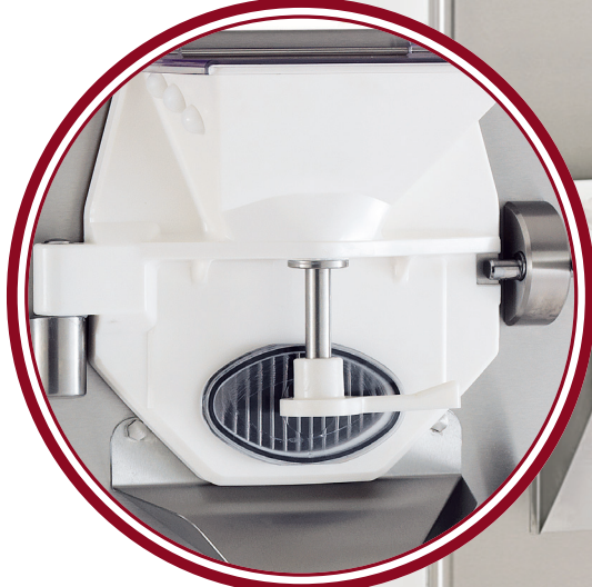
portello Classic Classic door